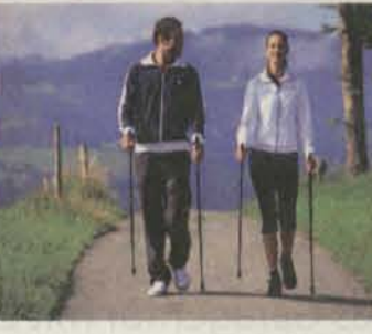
milgamma® protekt. Wirkstoff: Benfotiamin. Anwendungsgebiete: Behandlung von Neuropathien und kardiovaskulären Störungen, die durch Vitamin-B1-Mangel hervorgerufen werden. Therapie oder Prophylaxe von klinischen Vitamin-B1-Mangelzuständen, sofern diese nicht ernährungsbedingt behoben werden können. Zu Risiken und Nebenwirkungen lesen Sie die Packungsbeilage und fragen Sie Ihren Arzt oder Apotheker. Wörwag Pharma GmbH & Co. KG, Calwer Str. 7, 71034 Böblingen.

Ein natürliches, gut verträgliches Mittel gegen das Voranschreiten und die unangenehmen Symptome der Neuropathie ist der Wirkstoff Benfotiamin (als milgamma® protekt rezeptfrei in Apotheken erhältlich). Die vitaminähnliche Substanz schützt Nerven und Blutgefäße vor den schädlichen Auswirkungen des erhöhten Blutzuckers und wirkt dadurch den Folgeerkrankungen des Diabetes entgegen. Auch bereits bestehende Neuropathie-Beschwerden wie Kribbeln, Brennen, Taubheit oder Schmerzen in Füßen oder Händen kann milgamma® protekt lindern und die Nervenfunktion verbessern. Weitere Informationen unter www.milgamma.de