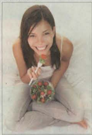
Durch eine ausgewogene Ernährung können wir unser Immunsystem unterstützen.

der auf die Bedeutung der immunologischen Forschung für die Gesundheit aufmerksam machen will. Ein Anlass für jeden, über die Unterstützung für sein Immunsystem nachzudenken und aktiv zu werden.