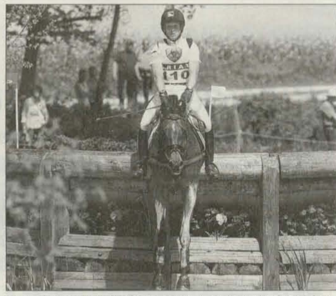
Die Vorbereitungen für die 26. Internationale Marbacher Vielseitigkeit vom 11. bis 13. Mai auf dem Gelände des Haupt- und Landgestüts Marbach laufen auf Hochtouren.