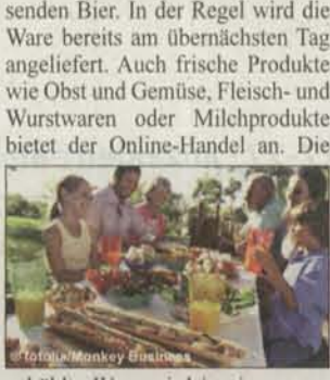
Bei ihrem ersten Einkauf bei Lebensmittel.de erhalten Sie einen Gutschein über 5 Euro. Einfach bei der Bezahlung das Kennwort: PICKNICK eingeben. Bedingungen: Gutschein gilt bei einem Kauf ab 30 Euro, nur für Neukunden von Lebensmittel.de und ist nicht unrenchenbar auf Tabakwaren, Servicegebühren und Pfand.

Ein gelungener Grillabend muss vorbereitet sein – und das bedeutet vor allem einkaufen: Holz, Würstchen, marinierten Weinen, diverse Saucen, und jede Menge Getränke müssen besorgt werden. Das kostet viel Geld und viel Zeit. Als echte Alternative bietet sich hier der Lebensmittelhandel an. Online kann man bequem zwischen den unterschiedlichsten Würstchen- und Saucensorten wählen und in aller Ruhe die Preise vergleichen. Als Internet-Lebensmittelhändler bietet www.lebensmittel.de eine große Auswahl an Grillzubehör. Von Grillanzündern und dem passenden Bier. In der Regel wird die Ware bereits am übernächsten Tag angeliefert. Auch frische Produkte wie Obst und Gemüse, Fleisch- und Wurstwaren oder Milchprodukte bietet der Online-Handel an. Die gekühlte Ware wird in eigens von www.lebensmittel.de konzipierten Freshboxen geliefert. Übrigens entfällt die Versandkostenpauschale von 4,90 Euro, wenn man über 40 Euro bestellt. Dank der günstigen Preise ist der Einkauf per Internet mit den Supermarktpreisen vergleichbar – bequemer ist er allemal.