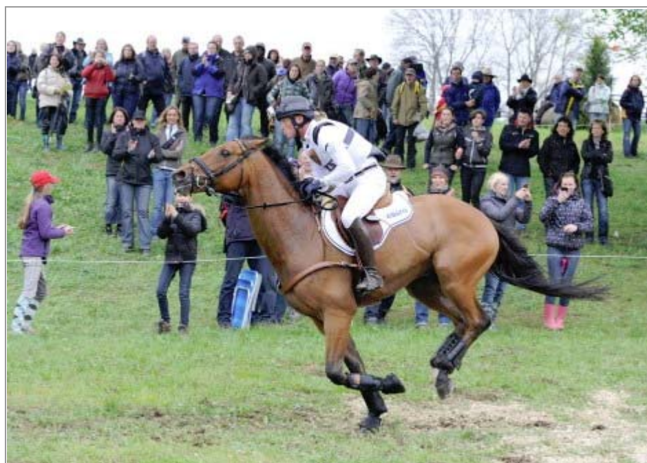
Rasante Galoppade im Gestüts-Gelände: Michael Jung feierte mit seinem Ausnahmepferd Sam einen Start-Ziel-Sieg.